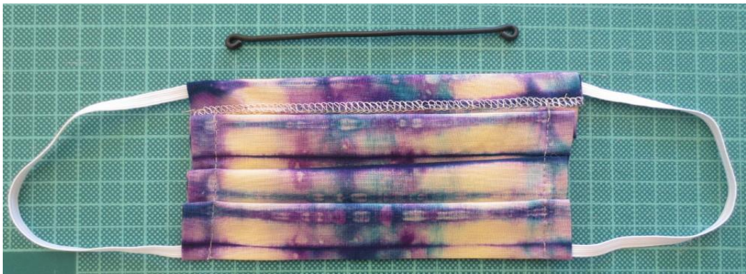
Die Mundmaske ist nun fertig genäht.